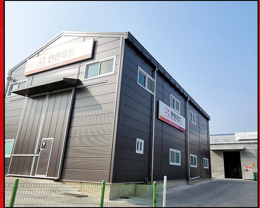
Factory and Store in South Korea