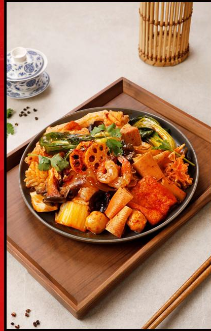
Mala Xiangguo (หม่าล่าผัดแห้ง)