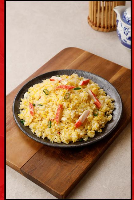
Korean Fried Rice (ข้าวผัดสไตล์เกาหลี)