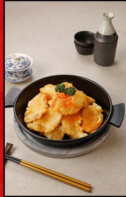
Guo Bao Rou (หมูกทอดซอสเปรี้ยวหวาน)