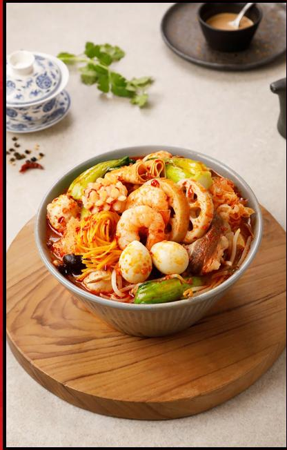
Mala Tang (หม่าล่ากั้ง)